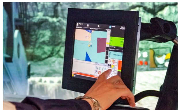
Panel Gambar tambahan Ekskavator