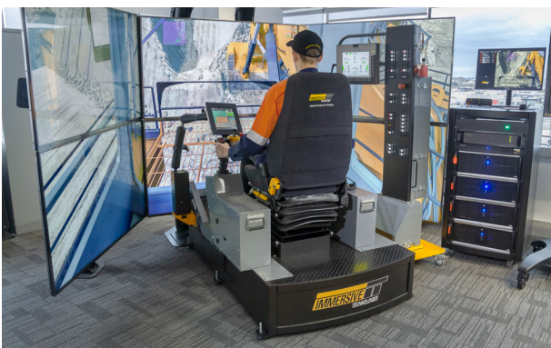
Simulator LX6 dilengkapi dengan panel otonom

Berfokus pada pengembangan kemampuan dalam penggunaan system otonom, Rio Tinto bermitra dengan Immersive Technologies untuk memberikan solusi guna mendukung jadwal kesiapan tambang dan tujuan. Produk pelatihan khusus mencakup platform yang mensimulasikan Excavator CAT 6060, Dozer CAT D10T, dan Grader CAT 18M. Semua modul simulator dilengkapi dengan panel sistem otonom dan menyediakan lingkungan yang aman dan efektif untuk pelatihan, dengan memungkinkan peserta pelatihan mengoperasikan peralatan sambil berinteraksi dengan truk otonom dan mengelola area kerja mereka sesuai kebutuhan.